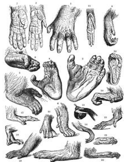
HANDS AND FEET OF APES AND MONKEYS. 1, 2, Gorilla; 3-6, Chimpanzee; 7, 8, Orang; 9, 10, Gibbon; 11, 12, Gouan; 13-15, Gouan; 16-18, Macaque; 19, 20, Baboon; 21, 22, Mandrill.

NEL DISEGNO A FIANCO È POSSIBILE VEDERE I PIEDI E LE MANI DI ALCUNE SCIMMIE ANTROPOMORFE. PUOI OSSERVARE I POLLICI OPPOINIBILI DELLA MANO E LA GRANDE SOMIGLIANZA CON QUELLA DEGLI ESSERI UMANI.