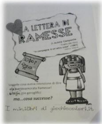
Figura 2 Piegare il foglio 1 tenendo presente che, ovviamente, la copertina deve essere la prima pagina del libretto.