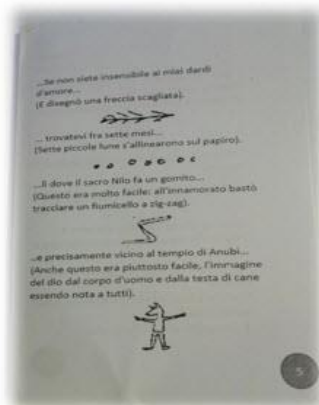
Figura 2 Piegare il secondo foglio in modo tale che la prima pagina del libretto sia la numero 5.