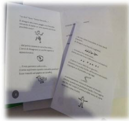
Figura 3. A questo punto non ti resta che inserire la seconda pagina piegata al centro della prima.