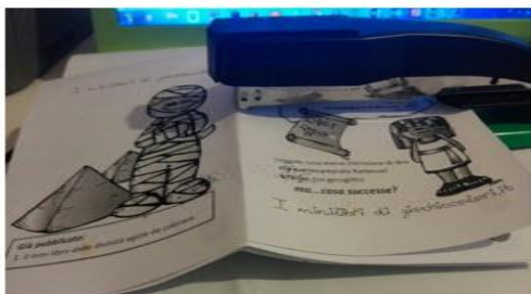
Figura 1. Per unire le pagine fra loro basta un punto di pinzatrice al centro.