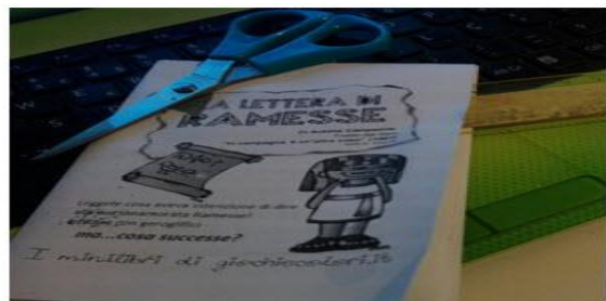
Figura 2. Separa le pagine in alto tagliandole con le forbici o usa un righello (io trovo comodo quest'ultimo sistema).

A questo punto potrai sfogliare liberamente le 16 pagine del libretto 😊