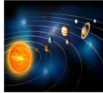
il sistema solare

E la storia non finisce qui: per i Babilonesi ogni ora del giorno era dedicata ad uno dei sette "pianeti" allora conosciuti: Sole, Luna, Mercurio, Venere, Marte, Giove, Saturno. La prima ora del giorno dava il nome al giorno. Per questo motivo Lunedì deriva da Luna, Martedì da Marte, Mercoledì da Mercurio, Giovedì da Giove, Venerdì da Venere, Sabato da Saturno, Domenica dal Sole.