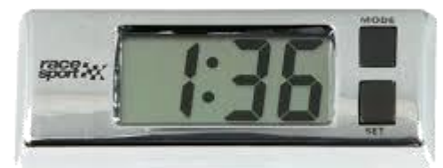
OROLOGIO DIGITALE (a cristalli liquidi)