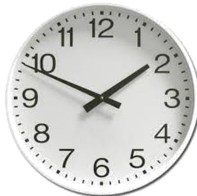
OROLOGIO ANALOGICO (con lancette)