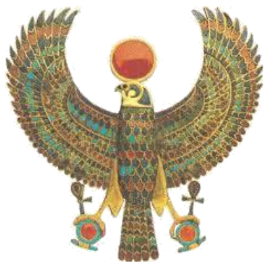
IL DIO EGIZIO HORUS

Nessuno sa quando e da chi è stato inventato l'orologio. Uno dei primi orologi meccanici fu realizzato dall'italiano Giovanni Dondi nel 1365.