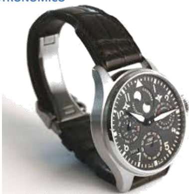
OROLOGIO DA POLSO