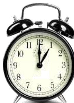
OROLOGIO A SVEGLIA