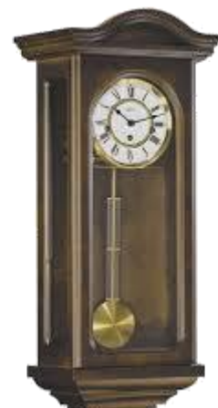
OROLOGIO A PENDOLO