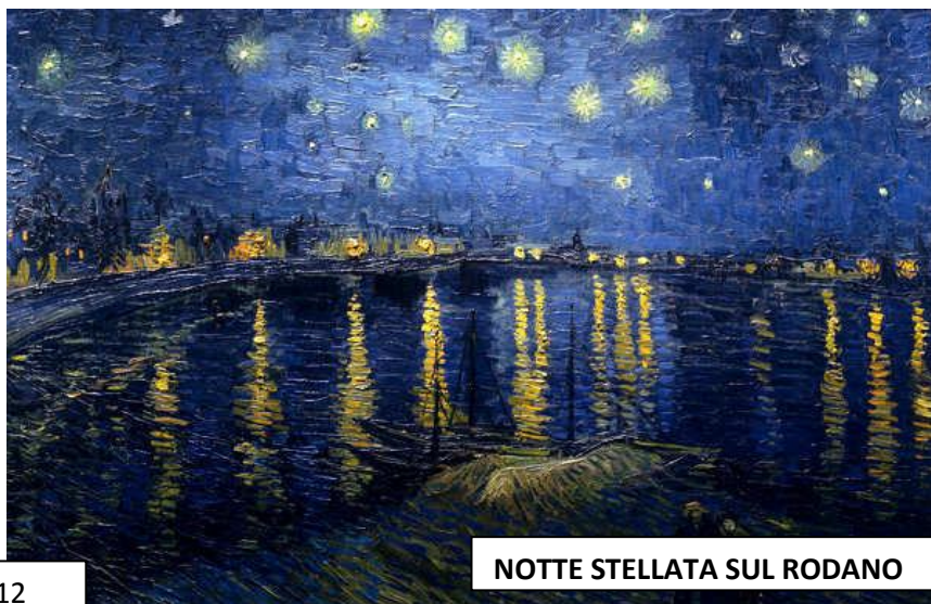
NOTTE STELLATA SUL RODANO

Dopo aver vissuto due anni a Parigi e frequentato un corso di disegno, mi trasferisco ad Arles, una città della Provenza, nel sud della Francia. Questo è un dipinto che ritrae la casa gialla dove sono andato ad abitare.