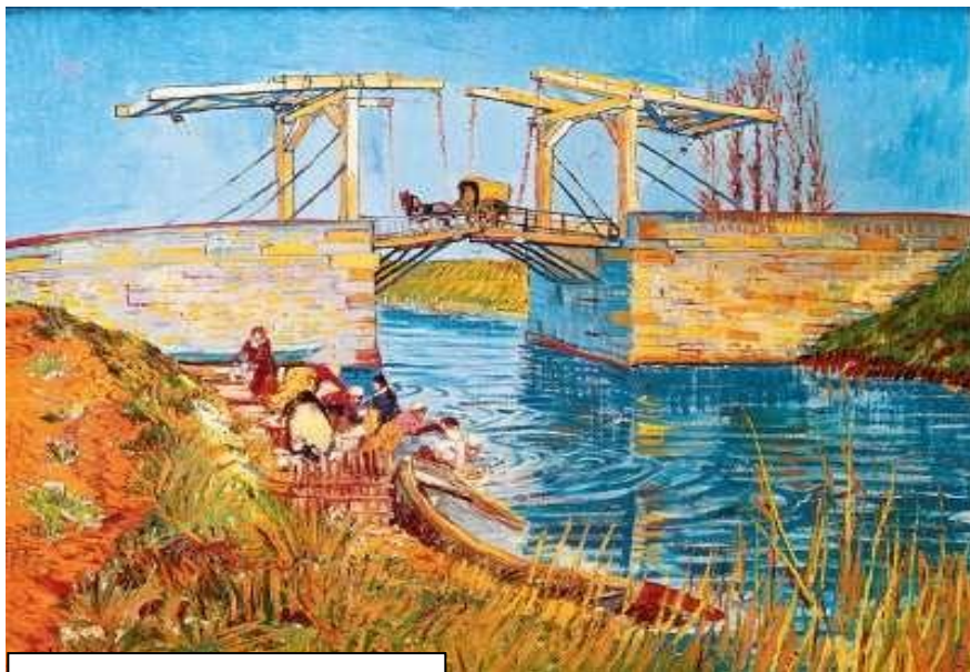
IL PONTE DI LONGLOIS