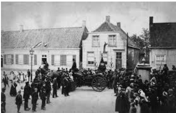
LA CASA DI VAN GOGH A GROOT ZUNDER

In questo paese frequento la scuola ma, a dir la verità, non mi piace molto e prendo sempre brutti voti. Per questo motivo facevo arrabbiare sempre mio papà che era molto severo con me e i miei fratellini più piccoli.